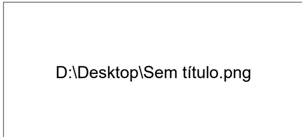
Casa Dia do Idoso 1