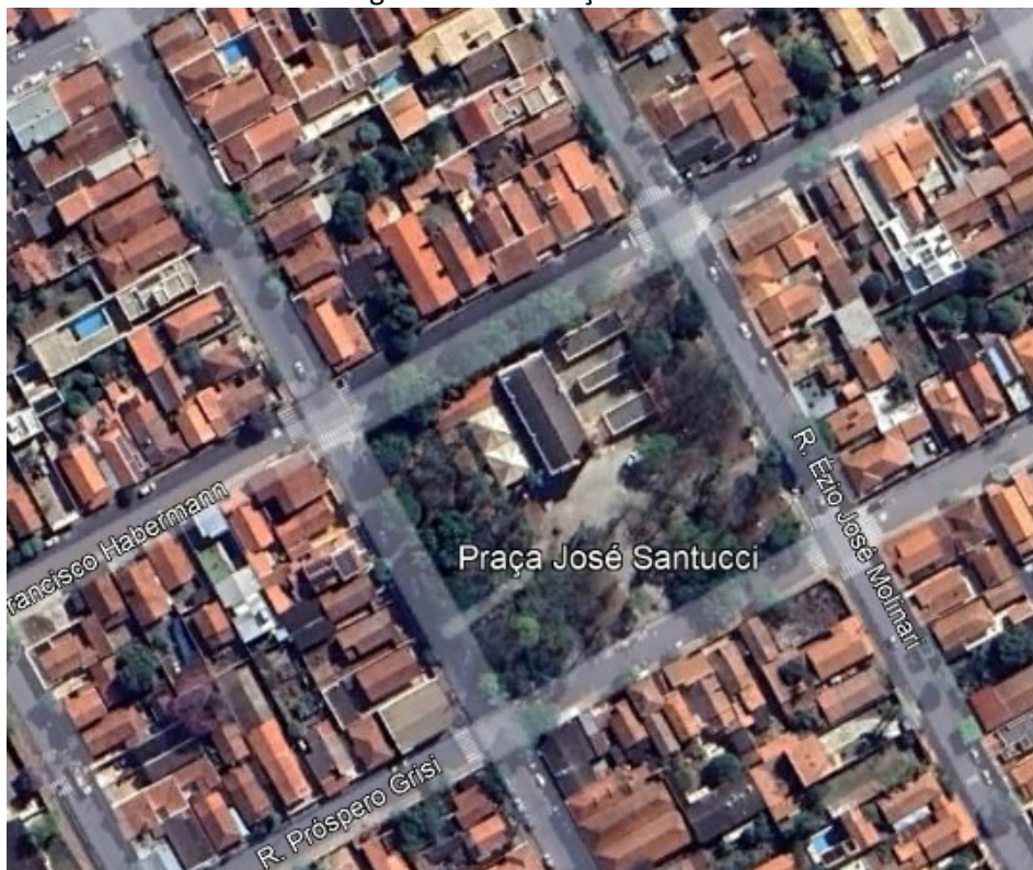
Imagem 1 – Localização da área