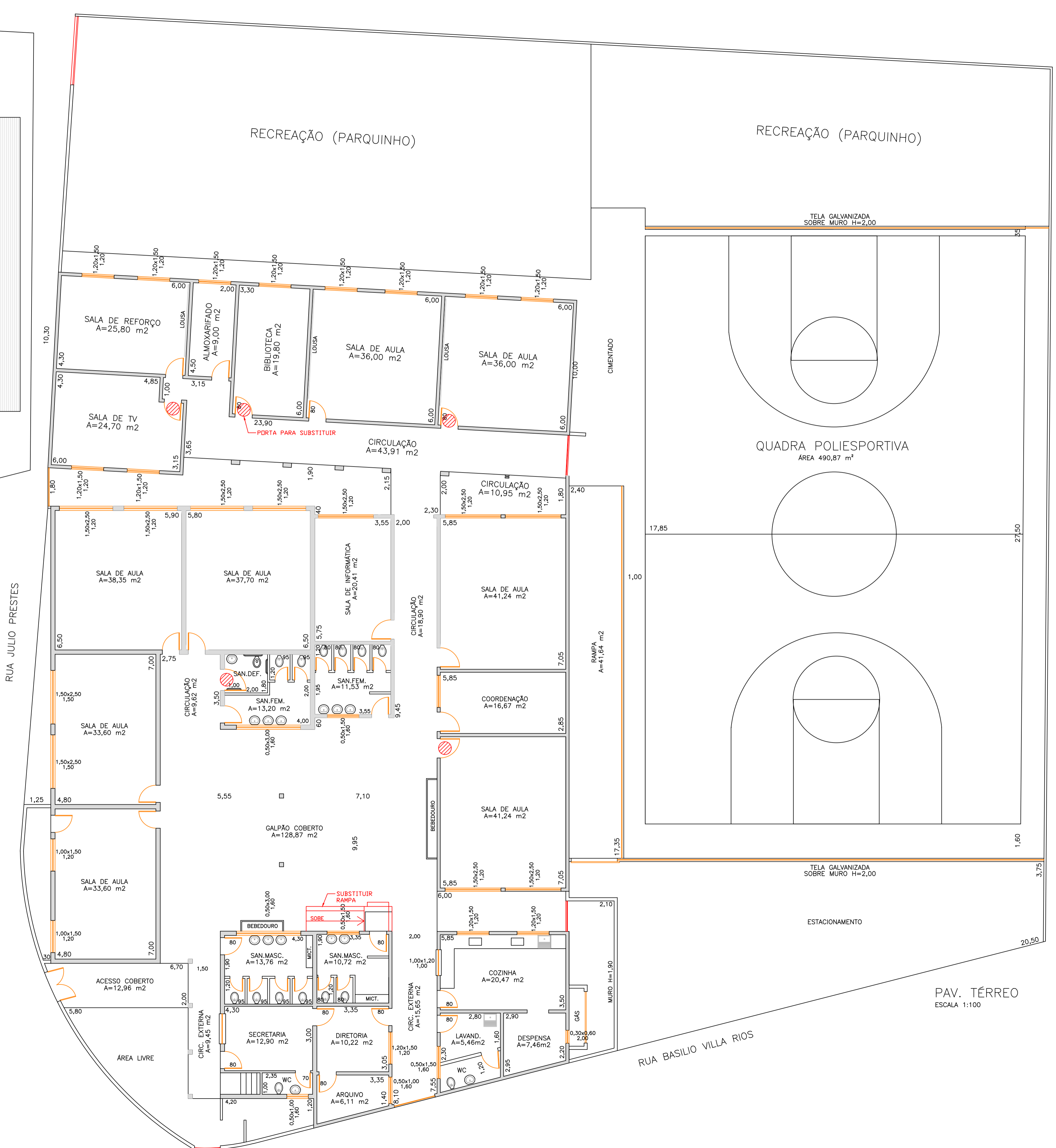
PAV. TÉRREO ESCALA 1:100