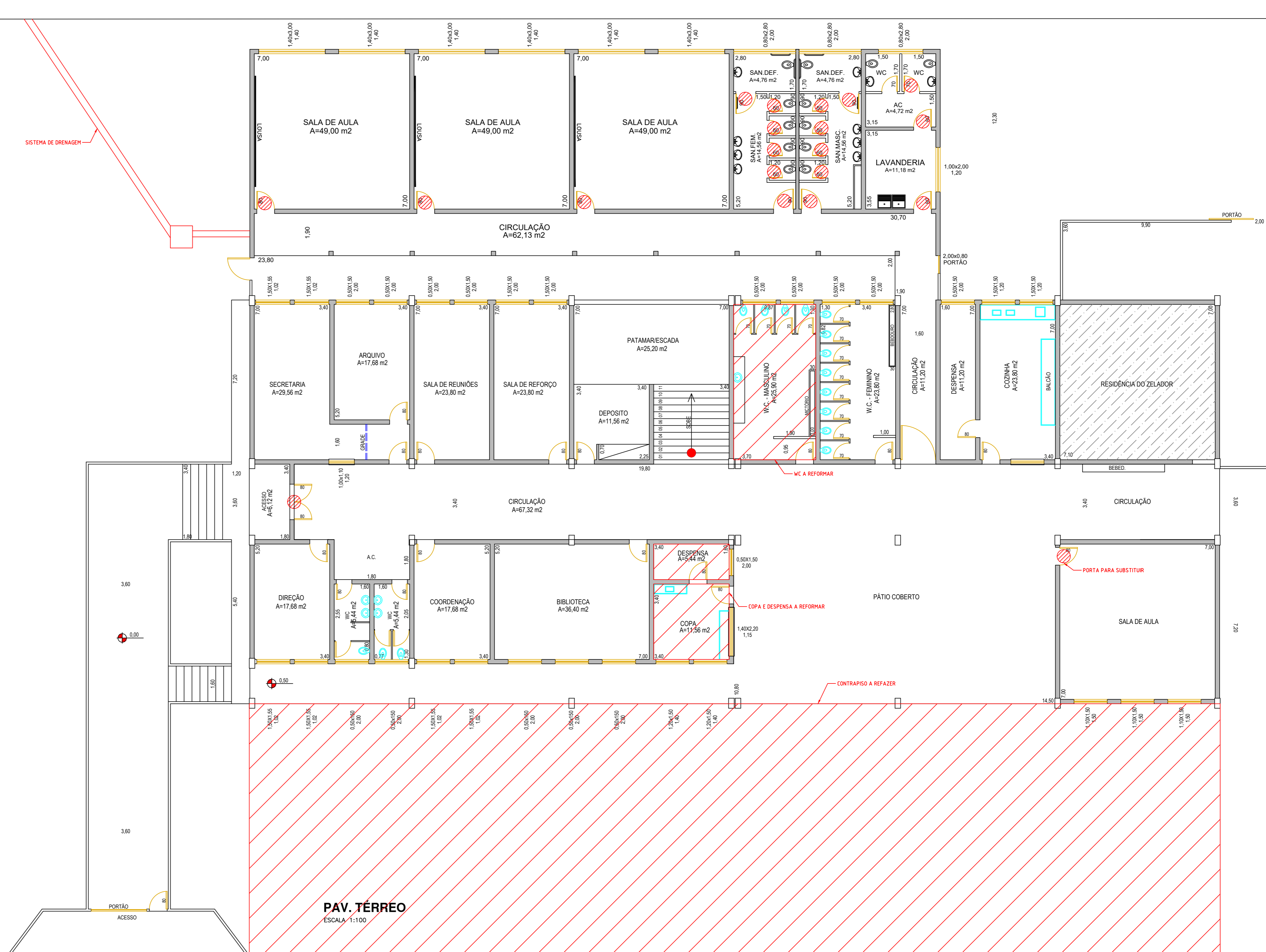
PAV. TÉRREO ESCALA 1:100