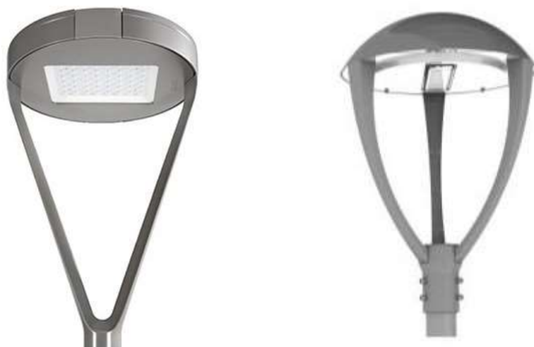
Modelos da luminária para execução.

Os postes existentes na praça deverão ser mantidos, as luminárias de vapor de sódio deverão ser trocadas por novas de LED de 120W Cor: 6000k.