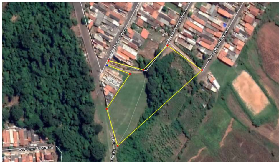
Imagem 1 – Localização da área

Nas imagens 2, 3 e 4 a seguir está a representação da situação atual do terreno, por meio de fotos tiradas no local: