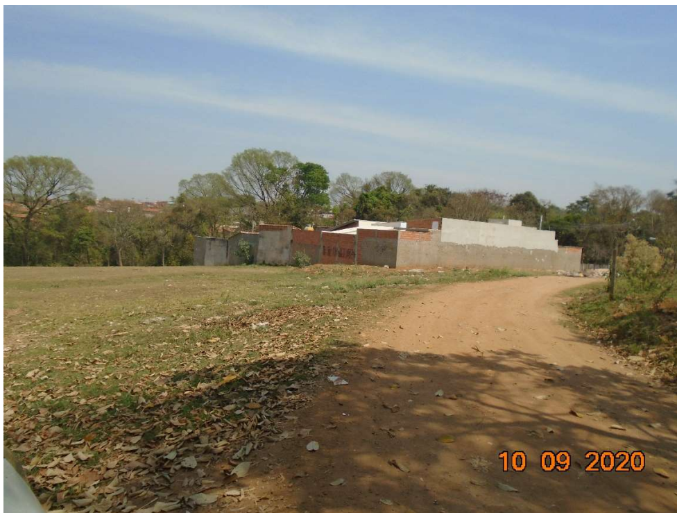
Imagem 3 – Situação atual do terreno

O objetivo é urbanizar o terreno existente, hoje em desuso, otimizando o espaço público e proporcionando local de lazer para a população da região.