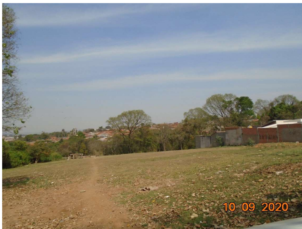
Imagem 2 – Situação atual do terreno

Nas imagens 2, 3 e 4 a seguir está a representação da situação atual do terreno, por meio de fotos tiradas no local: