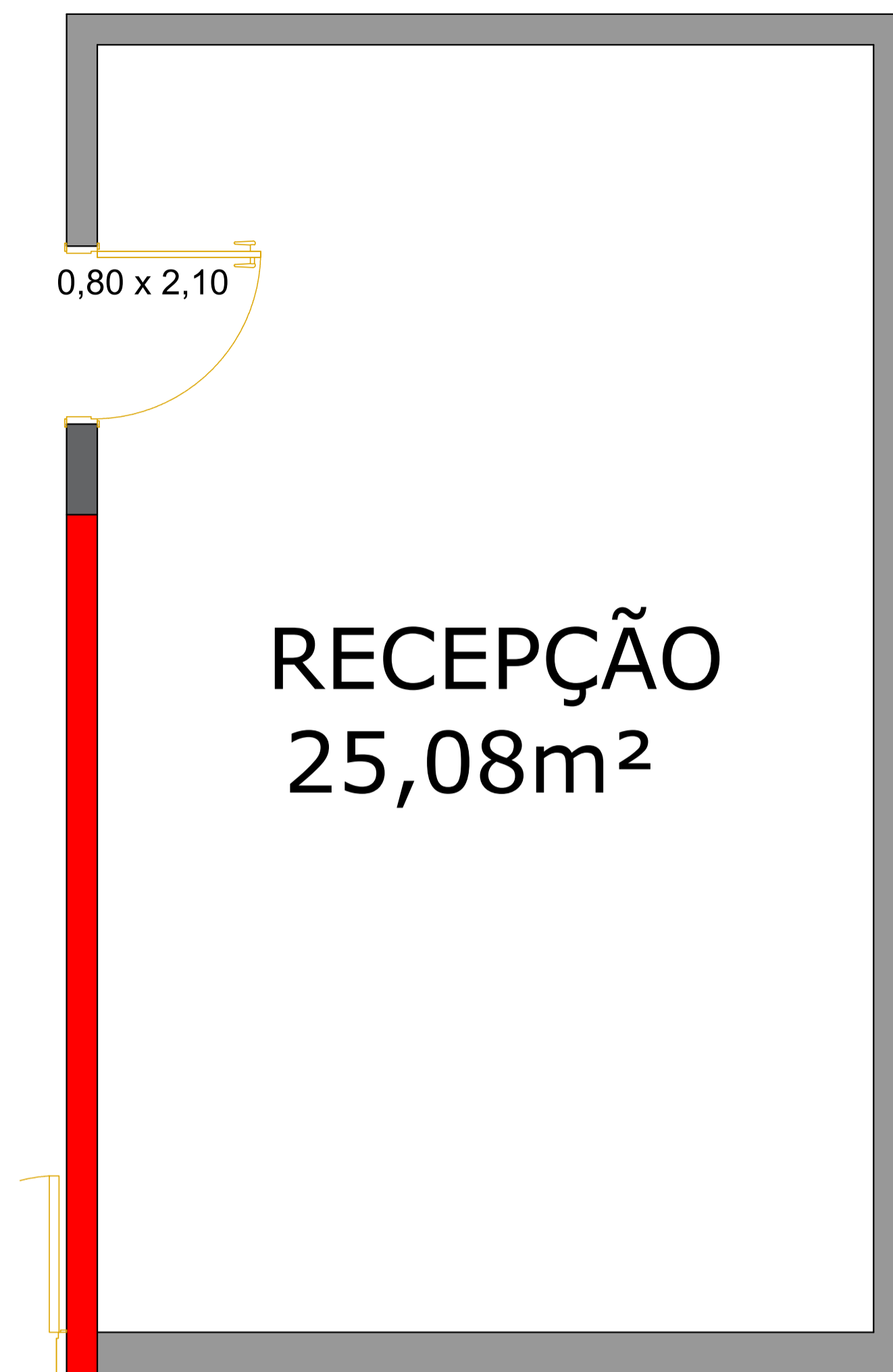
RECEPÇÃO - 25,08 m 2 ESCALA 1:25