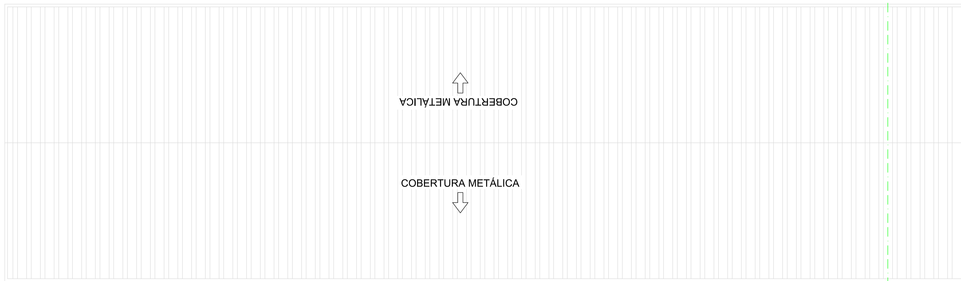
PLANTA DE COBERTURA