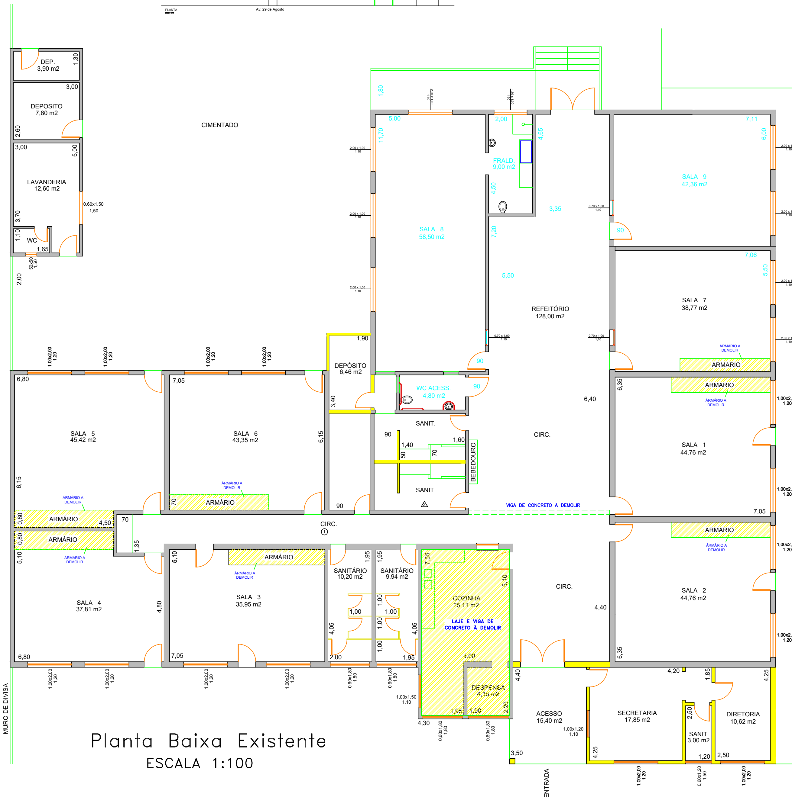
Planta Baixa Existente ESCALA 1:100